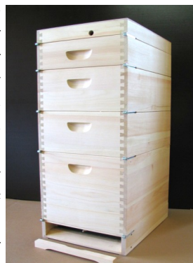
Abb.4: Beispiel Erlanger System mit hohem Brutraum (Zadant) und zwei Schichtenzargen

Mit unserem EMB-MS-Beutenbaukasten kann jeder seine ideale Zusammenstellung finden. Schließlich brauchen persönliche Neigungen bei der Auswahl nicht zu kurz kommen. Gut, wenn man ein Beuten-System mit vielen Möglichkeiten hat.