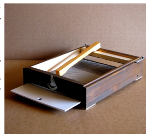
Abb.3: MS-Varroaboden Art.Nr. 10142L - von hinten, mit teilweise herausgezogenem Varroaschieber und aufgelegtem Flugkeil

Optional sind eine Bausperre und/oder ein stabiles Wanderunterteil (für Sackkarre) erhältlich.