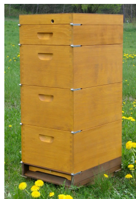
Abbildung 1. zeigt die derzeit klassische Kombination aus 1 St MS-Varroaboden, 3 St EMB-Zargen, 1 St MS-Deckel-Futtertrog, 1 St EMB-Deckel

Raum der richtige Wabenabstand (bee-space) konsequent eingehalten, was in der Folge auch zu entsprechenden Änderungen bei anderen Beutensystemen und Rähmchen führte.