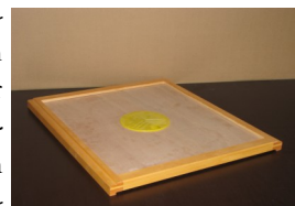
Abb.8: EMB-Bienenflucht mit einem Lega-Einsatz .

Der Markt bietet unterschiedliche Formen von Bienenfluchten an. Wir bauen die bewährte Legabienenflucht nach dem Erlanger System im gezapften Holzrahmen ein. Aufgrund der geringen Bauhöhe (bee-space) und der kurzen Verweildauer im Kasten sind hier keine Beschläge vorgesehen.