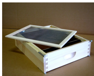
Abb.5: MS-Deckel-Futtertrog Art.Nr. 10150 mit herausgenommenen bienendichten Abdeckrahmen

Futterabnahme bienenfrei beobachtet und kontrolliert werden. Somit entfällt das lästige Räuchern beim Einfüttern völlig. Nach Verbrauch der letzten Futtergabe wird der Innenraum freigegeben: so gelangen die Bienen auch noch an den letzten Futtertropfen und der Innenraum wird auf natürlichem Wege sauber.