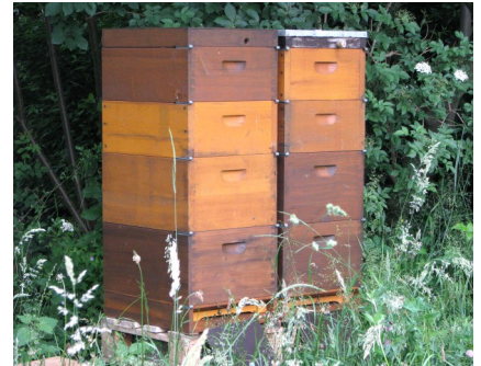
Abb.7: Eine überstehende Regenabdeckung ist vorteilhaft. Trotzdem haben diese Beuten schon viele Jahre am Buckel. Den Deckel mit Satteldach fertigen wir nur auf besondere Anfrage (s. Abb.6 links) Eine Blechabdeckung ist in Vorbereitung.