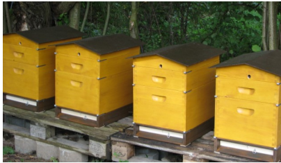
Abb.6: Die Ableger dürfen gleich fliegen. Ablegerstation mit MS-Varroaboden, EMB-Zarge, MS-Deckel-Futtertrog, EMB-Deckel mit MS-Satteldach

Zunächst soll er den Kasten bienendicht abschließen und vor Wind und Wetter zuverlässig schützen. Auch hier bewähren sich wieder die EMB-spezifischen Kipp- und Wanderbeschläge vorne und der Exzenter-